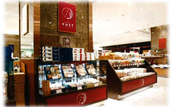
★遠鉄百貨店 新館地下1階の店舗の様子★