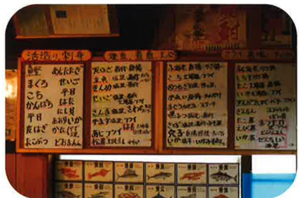
壁にはその日のお品書きが貼ってあります