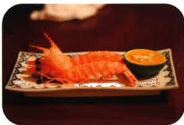
塩で焼いただけでも絶品の 海者の塩焼き