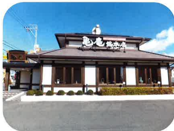
国道 152 号線沿いにある「亀庵総本店有玉店」