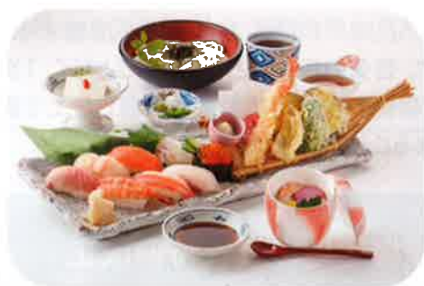
上寿司天ぷら御膳 2,000 円(+税)

平成 24 年 9 月からの顧問契約となりますが、 数字が非常に分かりやすくなり、各店長のモチベーションアップにつながりました。 今後ともよろしくお願ひします。