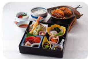
亀庵松華堂〈とんかつ〉 1,800 円 (+税)