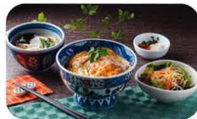
カツ丼セット 1,250 円 (+税)