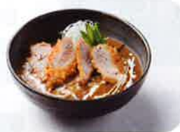
ヒレカツカレーうどん 1,100 円 (+税)