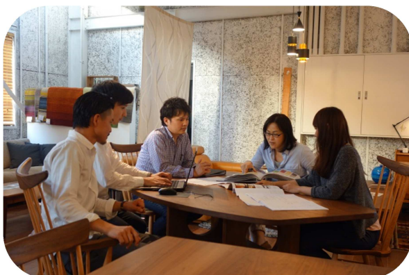
常に前向きな姿勢で仕事に取り組むスタッフの皆さん

起業した、平成24年度からお世話になっております。月時決算が出てくるので、タイムリーに会社の数字が確認できるので有難いです。それと、高林会計様はTKCグループに所属していらっしゃるの、最新のTKCのソフトが使えますし、 自社の業界の経営指標の水準などのデータが手に入るの、業界内での自社の数字の良し悪しがわかるのは非常に役立っています。