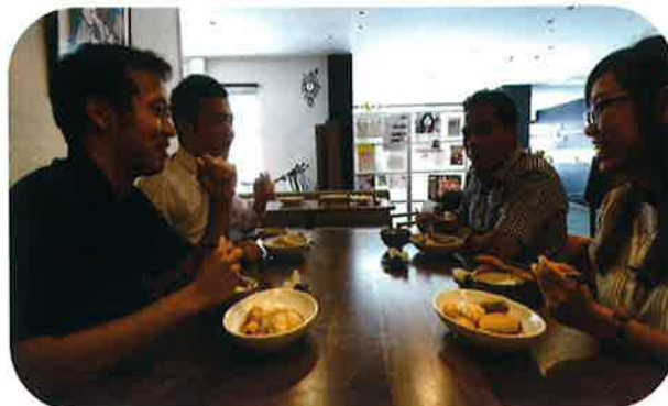
「はまぞうの職場は実に国際的だ。」