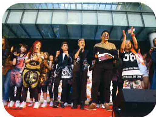
今年5月に行った「アジアミュージックフェスティバル」を開催。アジア各国の有名ミュージシャンが浜松に集合した。

いつも会計、税務を中心に丁寧なご指導に感謝いたします。これからも弊社がさらに成長していくためには、「戦略的会計」をできるプロ人材が弊社内にも必要になってきます。そういう人材の育成のためにもお力をお貸しください。